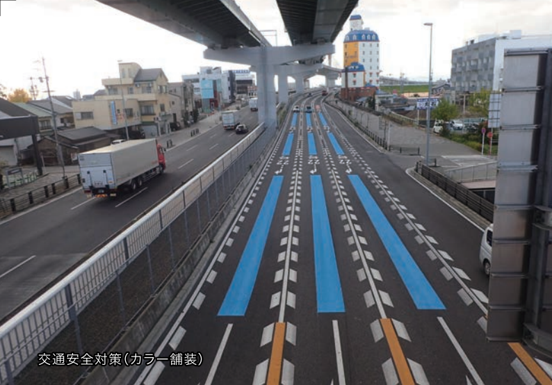
交通安全対策(カラー舗装)