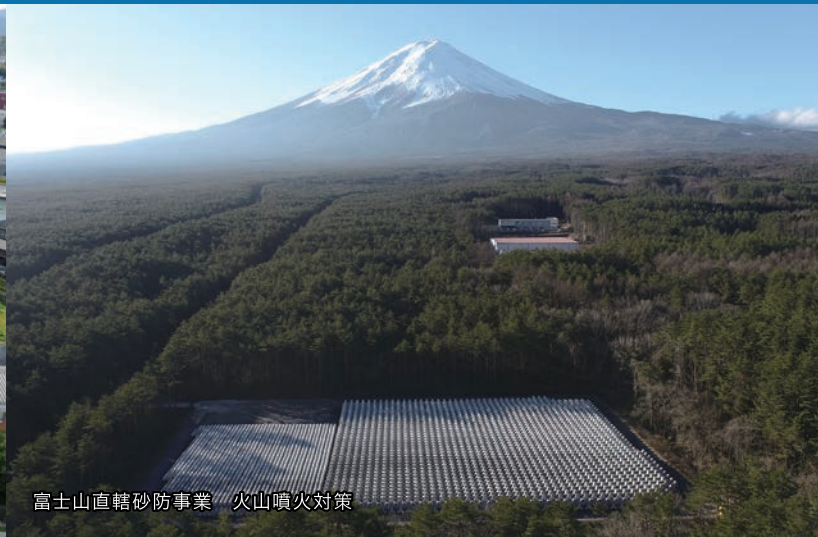
富士山直轄砂防事業 火山噴火対策