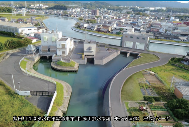
勢田川流域浸水対策緊急事業(松尻川排水機場 ポンプ増強) 完成イメージ