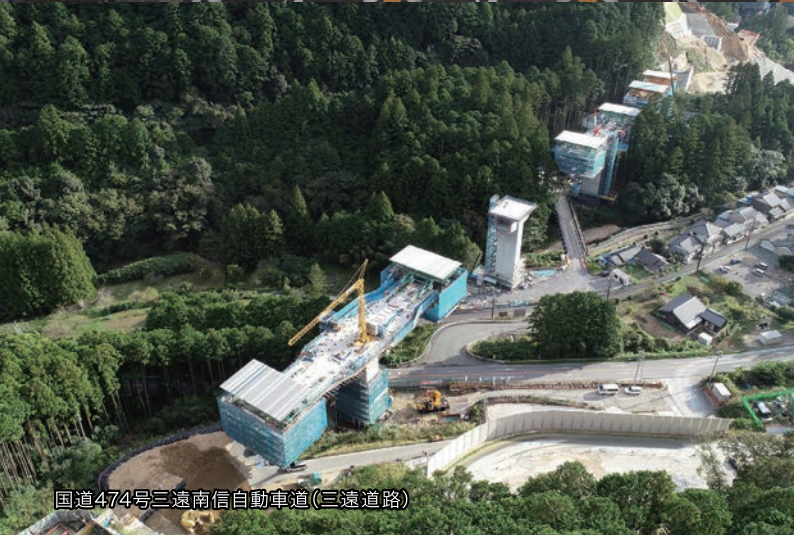
国道474号三遠南信自動車道(三遠道路)