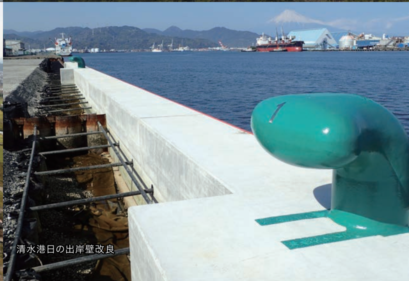
清水港日の出岸壁改良