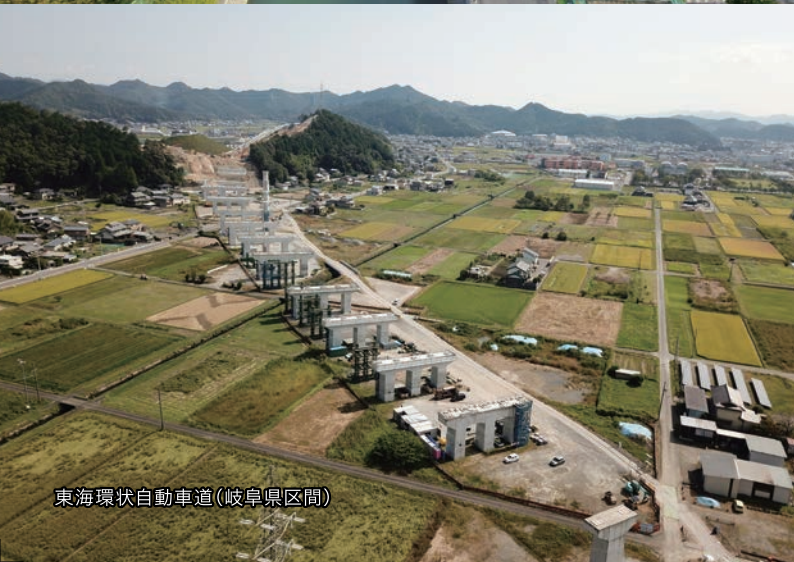
東海環状自動車道(岐阜県区間)