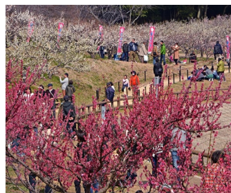
知多市観光ガイド HP より

佐布里池周辺には、佐布里緑と花のふれあい公園が整備されています。このふれあい公園を中心に、薄紅色の佐布里梅や白色で一重の白加賀梅など、25 種類 5,700 本の梅が植えられており、2 月から 3 月にかけて、美しい梅が咲き誇ります。一帯では梅の開花時期に合わせて佐布里池梅まつりが開催され、毎年 17 万人もの観梅客が訪れます。(平成 31 年は 2 月 9 日(土)から 3 月 10 日(日))