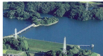
佐布里池ダムカードより

今年 1 月 2 日の特別番組では、耐震補強工事のために 2 か月かけて水を抜く佐布里池も登場し、今後続編も予定されています。