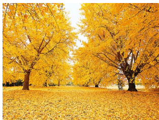
Aichi Now HP より