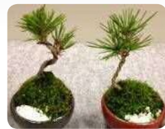
今月のあいちの花HPより

平成31年1月のあいちの花は「和物」です。「和物」は、トキソウなどの日本在来の草花、黒松などの植木、千両、万両などの実付きの植物等、「日本の四季や