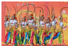
名古屋中国春節祭 HP より

中国の文化を伝えるイベントとして、民俗舞踊や中国楽器の演奏、武術の披露などが行われ、過去には少林寺武僧団による演武や、手を使わずに次々に面を変化させる「変面」などのパフォーマンスも行われています。また、中国料理が味わえる屋台では、中国では年越しに食べる水餃子など本場の味を楽しむことができ、食材や物産・雑貨の販売も行われます。