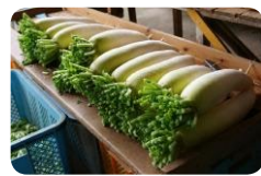
愛知県園芸農産課 HP より

大根は、古くから日本の食卓に欠かせない野菜で、消化を助ける酵素など、体に良い成分を多く含んでいます。日本には稲作とともに中国から伝わったとされ、世界一多品種で高品質です。別名はスズシロと呼ばれ、春の七草のひとつにもなっています。