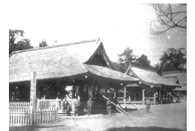
地震後の真清田神社 （濃尾大震災寫真帖より）