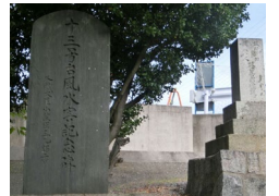
十三号台風水害記念碑（左） ( https://jinja.dr-leather.com/aiichi-nisio-24/ より)

一色町には、明治 22 年の水害、昭和 28 年 13 号台風にまつわる記念碑が数多く残されています。坂田神社にある十三号台風水害記念碑はそのひとつです。過去の災害の経験や教訓の言い伝えとともに、それを人々の心に刻み続けるべく、記念碑として災害の記録が残されています。