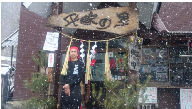
訪問時、雪が舞っていました

平家の里 長野県伊那市長谷市野瀬 1519-5 Tel.0265-98-2847 営業時間/11:00~13:30、17:00~20:30 定休日/不定休日あり、詳細は電話にて