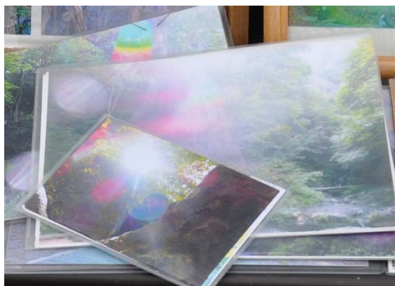
写真-1 不思議な写真