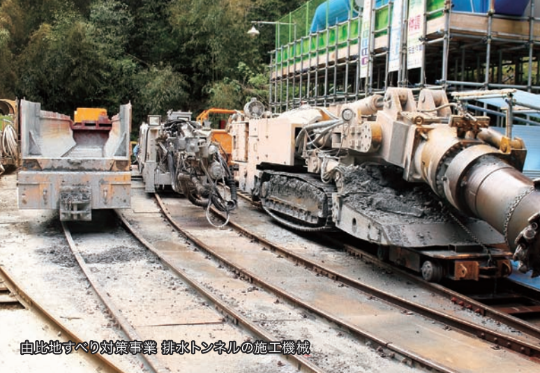
由比地すべり対策事業 排水トンネルの施工機械