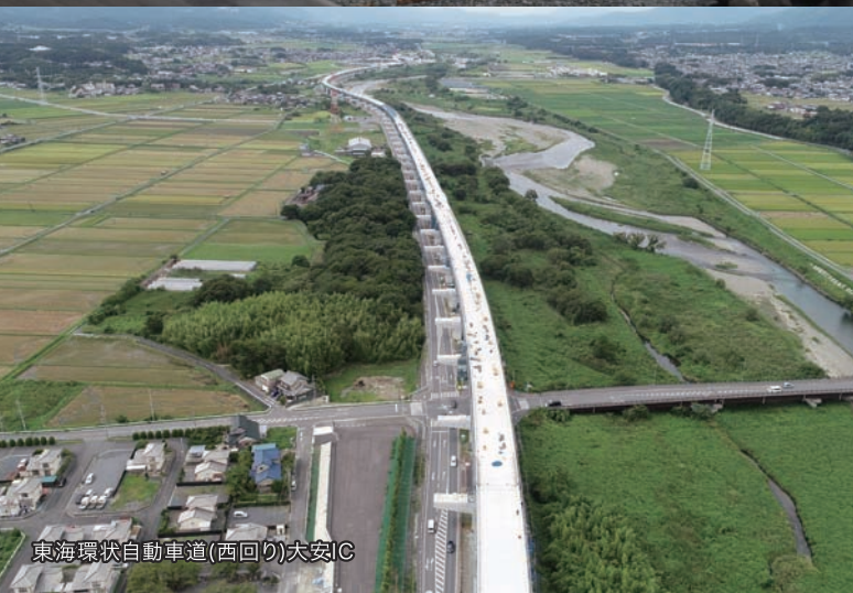
東海環状自動車道(西回り)大安IC