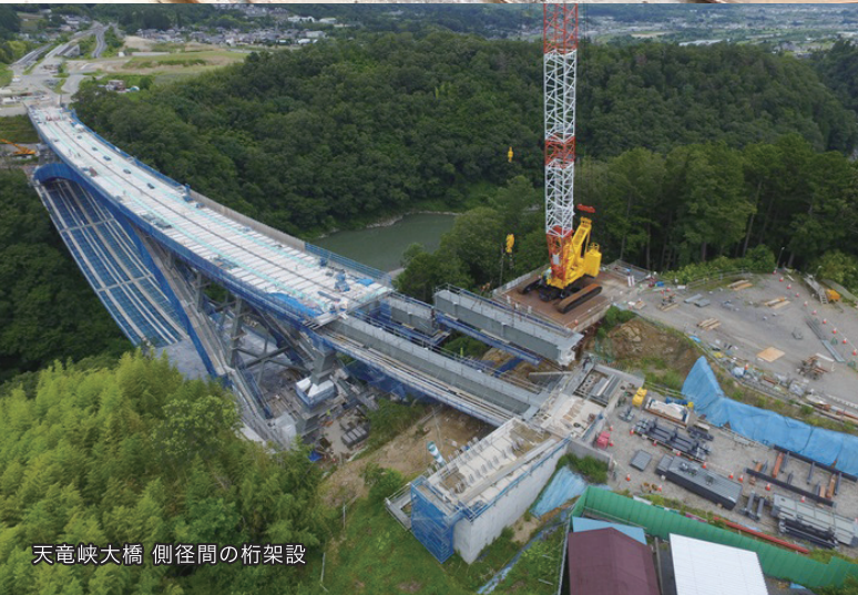
天竜峡大橋 側径間の桁架設