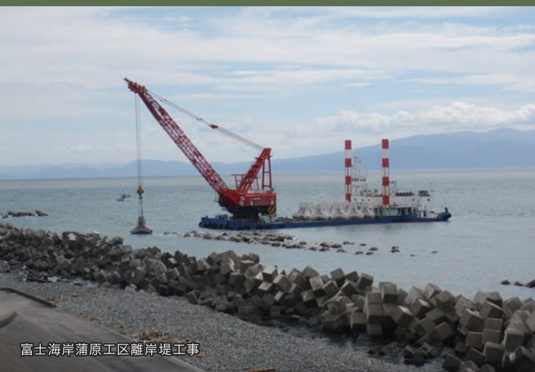
富士海岸蒲原工区離岸堤工事