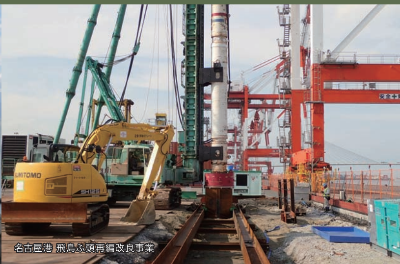
名古屋港 飛島ふ頭再編改良事業