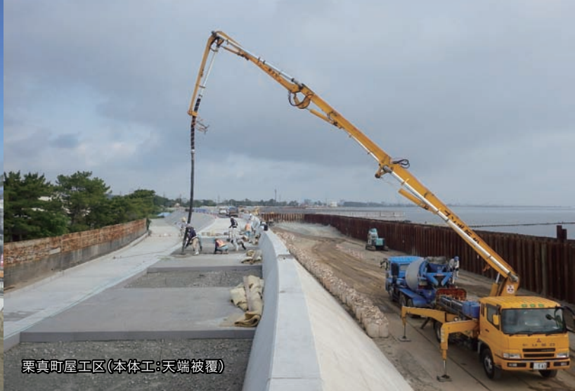
栗真町屋工区(本体工:天端被覆)