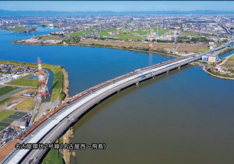
名古屋環状2号線(名古屋西～飛鳥)