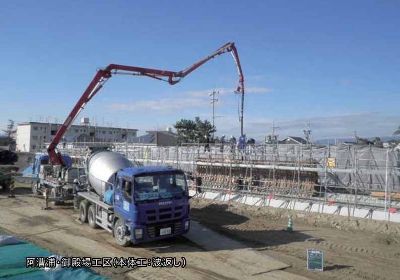
阿漕浦・御殿場工区(本体工:波返し)