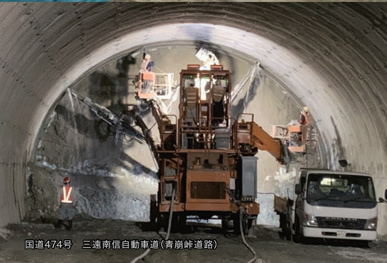
国道474号 三速南信自動車道(青崩峠道路)