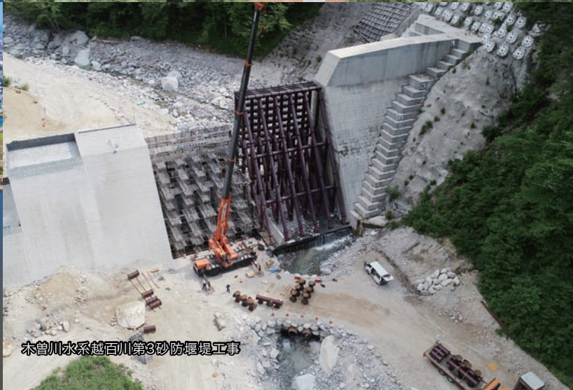
木曾川水系越百川第3砂防堰堤工事