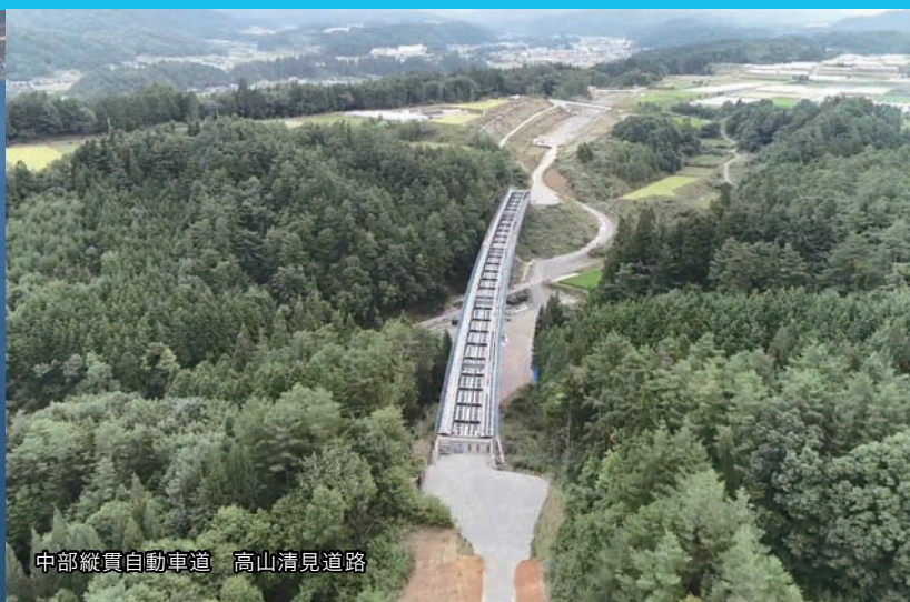
中部縦貫自動車道 高山清見道路